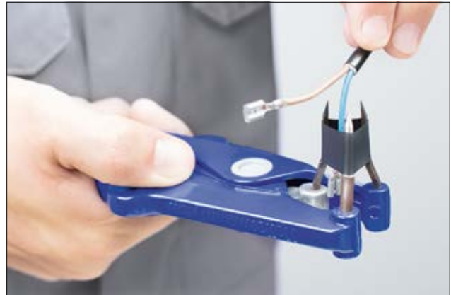
Mise en œuvre rapide et sécurisée grâce aux outils d'expansion à 3 becs.