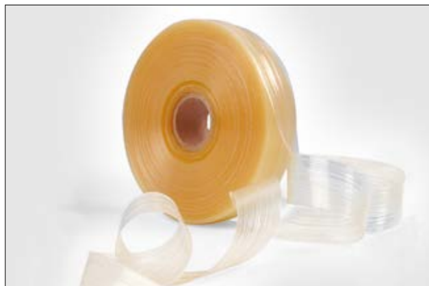
Ruban thermofusible HMT200A.