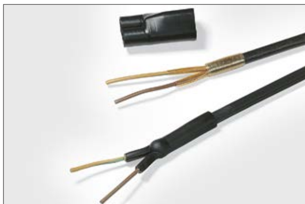
Ruban adhésif HMT200A, pour une étanchéité à l'humidité.