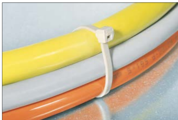
Collier PT220 en application.

Les colliers en PEEK ont été spécialement conçus pour les environnements contraignants et exigeants. Leur excellente performance à hautes températures les rend particulièrement adaptés aux industries ferroviaire et automobile, ainsi que pour les plateformes pétrolières. Leur grande résistance aux produits chimiques permet leur utilisation dans les industries chimique, nucléaire et médicale. Ces colliers sont également appréciés dans le secteur de l'aéronautique grâce à leur très bon rapport poids / résistance mécanique. Les nombreux avantages et les excellentes performances des colliers en PEEK permettent leur utilisation en lieu et place de solutions métalliques.