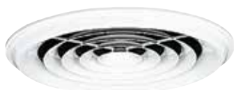
Diffuseur SC 831

Le SC 831 est un diffuseur circulaire concentrique en acier pour la diffusion d'air fixe et un soufflage horizontal.