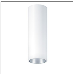
Plafonnier apparent à LED P-INF SC R100 LED1600-930 LDO SM WH 60818403

La présente déclaration de produit environnemental (EPD) est basée selon les normes EN ISO 14025 et EN 15804 et décrit les impacts spécifiques environnementaux du produit mentionné. Cette déclaration fait suite également aux exigences spécifiques et concrètes du programme Institut Bauen und Umwelt e.V. (IBU) selon les règles de calcul des LCA et le contenu de l'EPD (de base) selon les instructions de PCR sous-jacentes (PCR: Règles de catégorie de produit) pour «Luminaires, lampes et composants pour luminaires» (Ref: IBU PCR Teil A et B). Le produit décrit sert d'unité déclarée. La déclaration inclut une description du produit, des informations sur la composition des matériaux, la production, le transport, la phase d'utilisation, l'élimination et le recyclage, ainsi que les résultats de l'évaluation du cycle de vie. Les EPD des produits de construction sont comparables uniquement si les valeurs sont calculées conformément au même PCR et des scénarios d'utilisation appropriés et obligatoires.