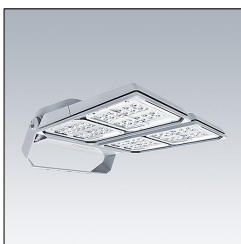
Projecteur LED grands espaces AFP L 144L85-740 A6 HFX CL2 GY 96633294

La présente déclaration de produit environnemental (EPD) est basée selon les normes EN ISO 14025 et EN 15804 et décrit les impacts spécifiques environnementaux du produit mentionné. Cette déclaration fait suite également aux exigences spécifiques et concrètes du programme Institut Bauen und Umwelt e.V. (IBU) selon les règles de calcul des LCA et le contenu de l'EPD (de base) selon les instructions de PCR sous-jacentes (PCR: Règles de catégorie de produit) pour «Luminaires, lampes et composants pour luminaires» (Ref: IBU PCR Teil A et B). Le produit décrit sert d'unité déclarée. La déclaration inclut une description du produit, des informations sur la composition des matériaux, la production, le transport, la phase d'utilisation, l'élimination et le recyclage, ainsi que les résultats de l'évaluation du cycle de vie. Les EPD des produits de construction sont comparables uniquement si les valeurs sont calculées conformément au même PCR et des scénarios d'utilisation appropriés et obligatoires.