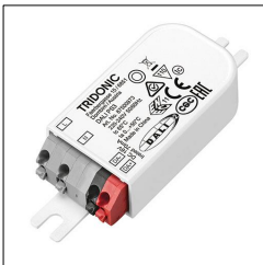
IPS 32 DALI 70 mA DALI PS3 87500873