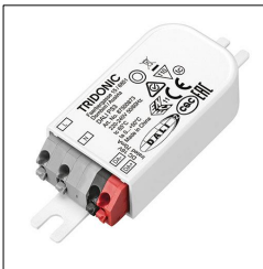
IPS 32 DALI 70 mA DALI PS3 87500873

La présente déclaration de produit environnemental (EPD) est basée selon les normes EN ISO 14025 et EN 15804 et décrit les impacts spécifiques environnementaux du produit mentionné. Cette déclaration fait suite également aux exigences spécifiques et concrètes du programme Institut Bauen und Umwelt e.V. (IBU) selon les règles de calcul des LCA et le contenu de l'EPD (de base) selon les instructions de PCR sous-jacentes (PCR: Règles de catégorie de produit) pour «Luminaires, lampes et composants pour luminaires» (Ref: IBU PCR Teil A et B). Le produit décrit sert d'unité déclarée. La déclaration inclut une description du produit, des informations sur la composition des matériaux, la production, le transport, la phase d'utilisation, l'élimination et le recyclage, ainsi que les résultats de l'évaluation du cycle de vie. Les EPD des produits de construction sont comparables uniquement si les valeurs sont calculées conformément au même PCR et des scénarios d'utilisation appropriés et obligatoires.