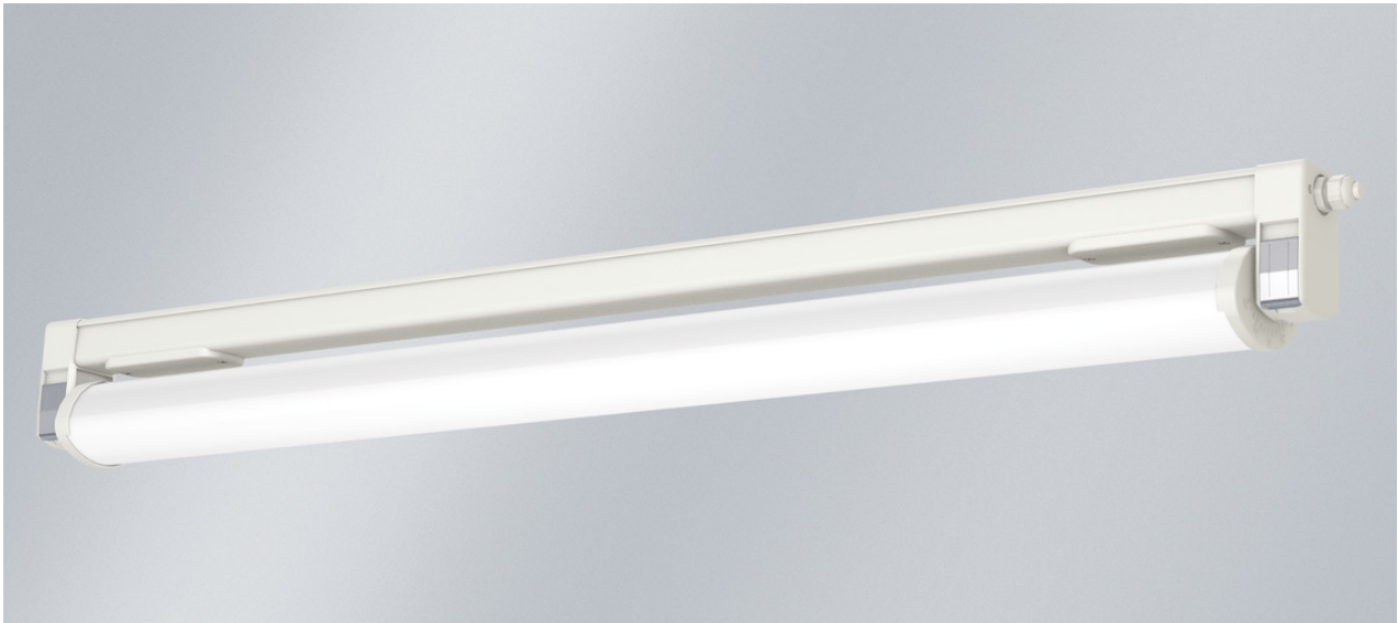
Abb. ggf. abweichend