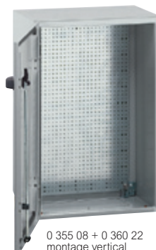
0 355 08 + 0 360 22 montage vertical