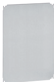
0 360 58