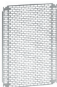
0 360 18