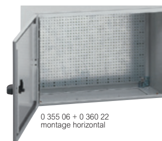
0 355 06 + 0 360 22 montage horizontal

Caractéristiques techniques p. 335 Visserie et fixation d'appareillage p. 368, 371