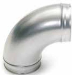
Coude 90° embouti

Le coude 90° permet de changer la direction d'un réseau galvanisé de 90°.