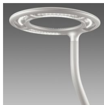
1786 Aura - rotosymétrique