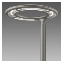
1781 Aura - piste cyclable-parcours piéton