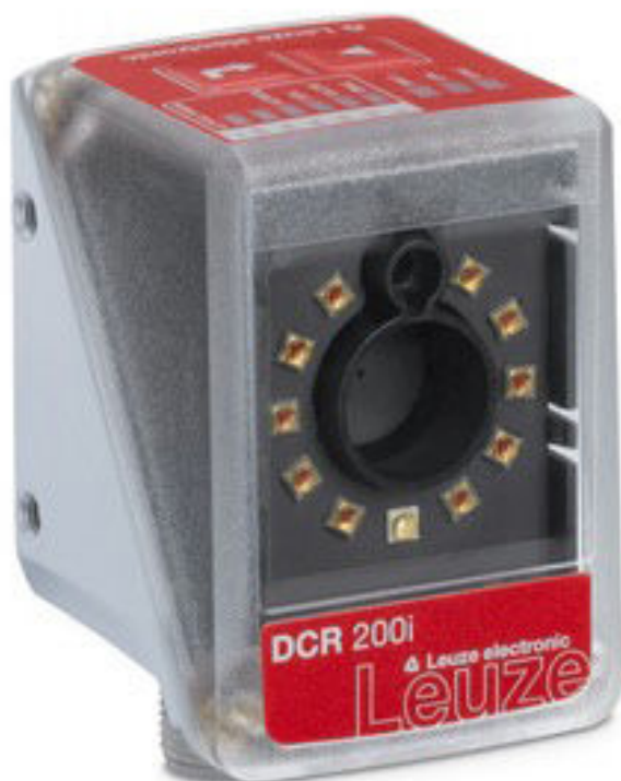
Figure pouvant varier