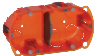
0 801 22