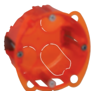
0 801 01