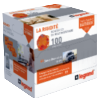
0 801 15