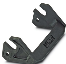
Étrier longitudinal pour boîtier B16, HC-EVO....AL et HC-STA....AL

Veillez tenir compte du fait que les données affichées dans ce document PDF proviennent de notre catalogue en ligne. Vous trouverez les données complètes dans la documentation utilisateur. Nos conditions générales d'utilisation des téléchargements sont applicables.