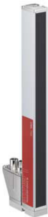
Figure pouvant varier