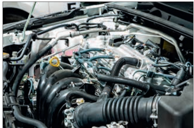
Gaine SA47-HT - Protection optimale contre l'humidité et haute tenue en température.