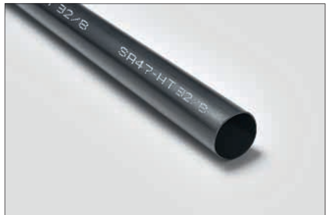
SA47-HT, pour des applications soumises à des températures pouvant atteindre jusqu'à +150 °C.