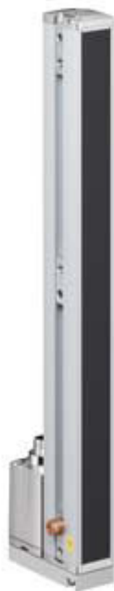
Figure pouvant varier