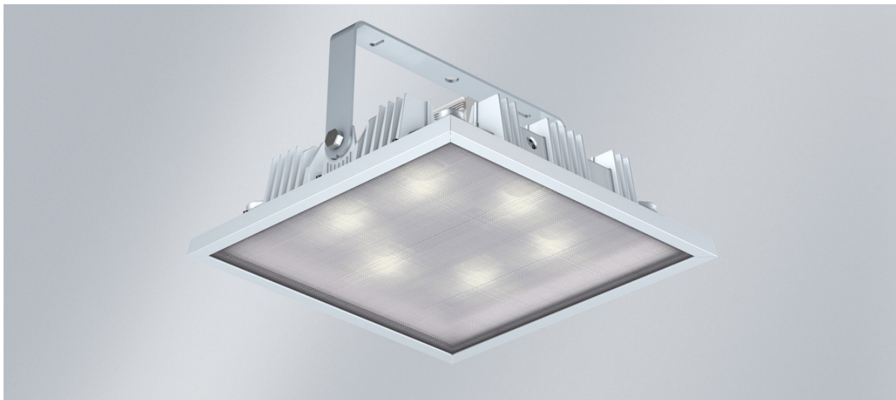
L'illustration peut différer