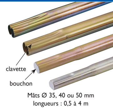
Mâts Ø 35, 40 ou 50 mm longueurs : 0,5 à 4 m