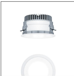
Plafonnier encastré à LED P-INF R200H LED2500-940 LDO WH WH 60818145

La présente déclaration de produit environnemental (EPD) est basée selon les normes EN ISO 14025 et EN 15804 et décrit les impacts spécifiques environnementaux du produit mentionné. Cette déclaration fait suite également aux exigences spécifiques et concrètes du programme Institut Bauen und Umwelt e.V. (IBU) selon les règles de calcul des LCA et le contenu de l'EPD (de base) selon les instructions de PCR sous-jacentes (PCR: Règles de catégorie de produit) pour «Luminaires, lampes et composants pour luminaires» (Ref: IBU PCR Teil A et B). Le produit décrit sert d'unité déclarée. La déclaration inclut une description du produit, des informations sur la composition des matériaux, la production, le transport, la phase d'utilisation, l'élimination et le recyclage, ainsi que les résultats de l'évaluation du cycle de vie. Les EPD des produits de construction sont comparables uniquement si les valeurs sont calculées conformément au même PCR et des scénarios d'utilisation appropriés et obligatoires.