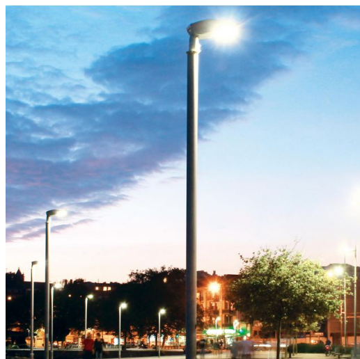
1418 Palo in acciaio ø102-159 da interrare