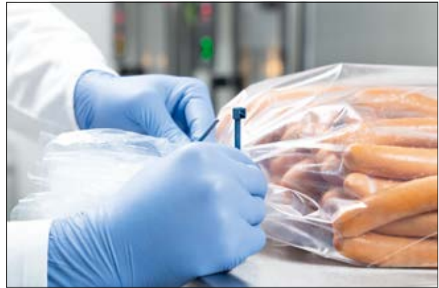
Collier MCT détectable et réouvrable pour une fermeture temporaire.