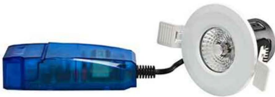
ENCASTRE LED'UP ECO 8W - BLANC