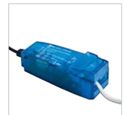
capot à clipsage rapide