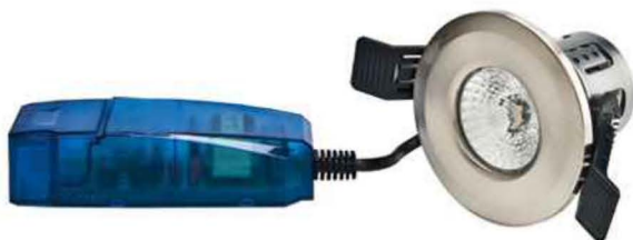
ENCASTRE LED'UP ECO 8W - ALU BROSSE