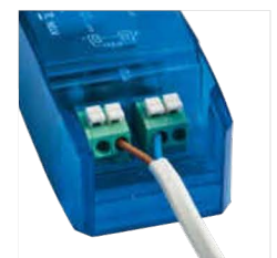
double bornier automatique