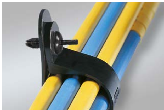
Rivet TY8P1, en application.