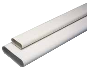
Barre de 3m Minigainé

Conduits rigides plastique MINIGAINÉ extra-plats pour réseau de ventilation en maison individuelle.