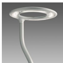
1441 Mât à enterrer