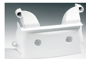
Cornet d'épanouissement Réf. 0935.054