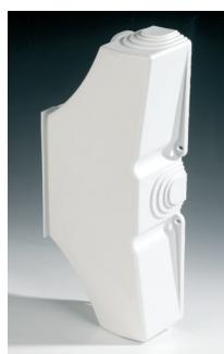
Cornet d'épanouissement latéral court 3 directions Réf. 0935.076