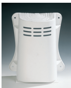
Cornet d'épanouissement long Réf. 0935.069