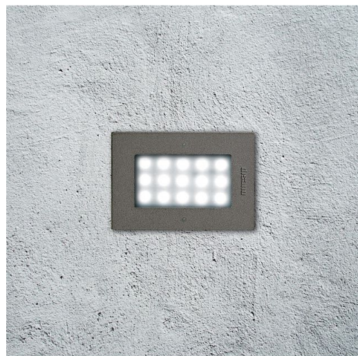
1673 Starled - rettangolare 230V