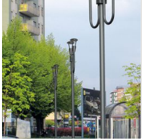
1491 Mât à enterrer