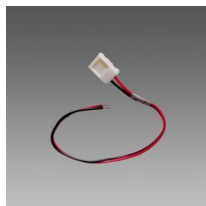
Connecteur avec câble - Strip LED IP20