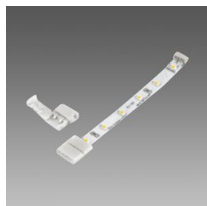
Connecteur pour ligne continue - Strip LED IP20