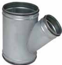
Té Oblique à joints

Le TO à joints permet de raccorder deux conduits galvanisés avec un angle de 45° tout en assurant une étanchéité classe C.