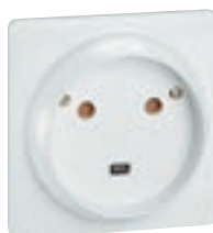
0 558 12