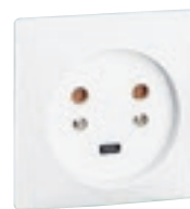
0 554 22