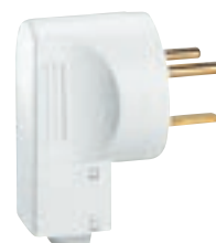
0 558 02