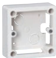
0 558 49