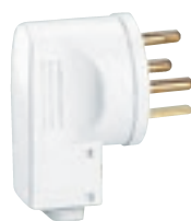
0 551 55