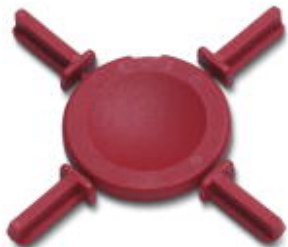
Etoile de détrompage, Longueur: 3 mm, Largeur: 3 mm, Hauteur: 6 mm, Coloris: rouge

Remarque : les données indiquées ici sont tirées du catalogue en ligne. Vous trouverez toutes les informations et données dans la documentation utilisateur. Les conditions générales d'utilisation pour les téléchargements sur Internet sont applicables. ( http://phoenixcontact.fr/download )