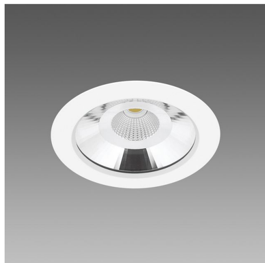
Jet 180 - IP65