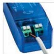
double bornier automatique