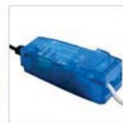
capot à clipsage rapide