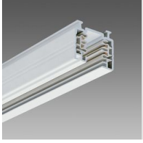
Omnitrack 3 allumages