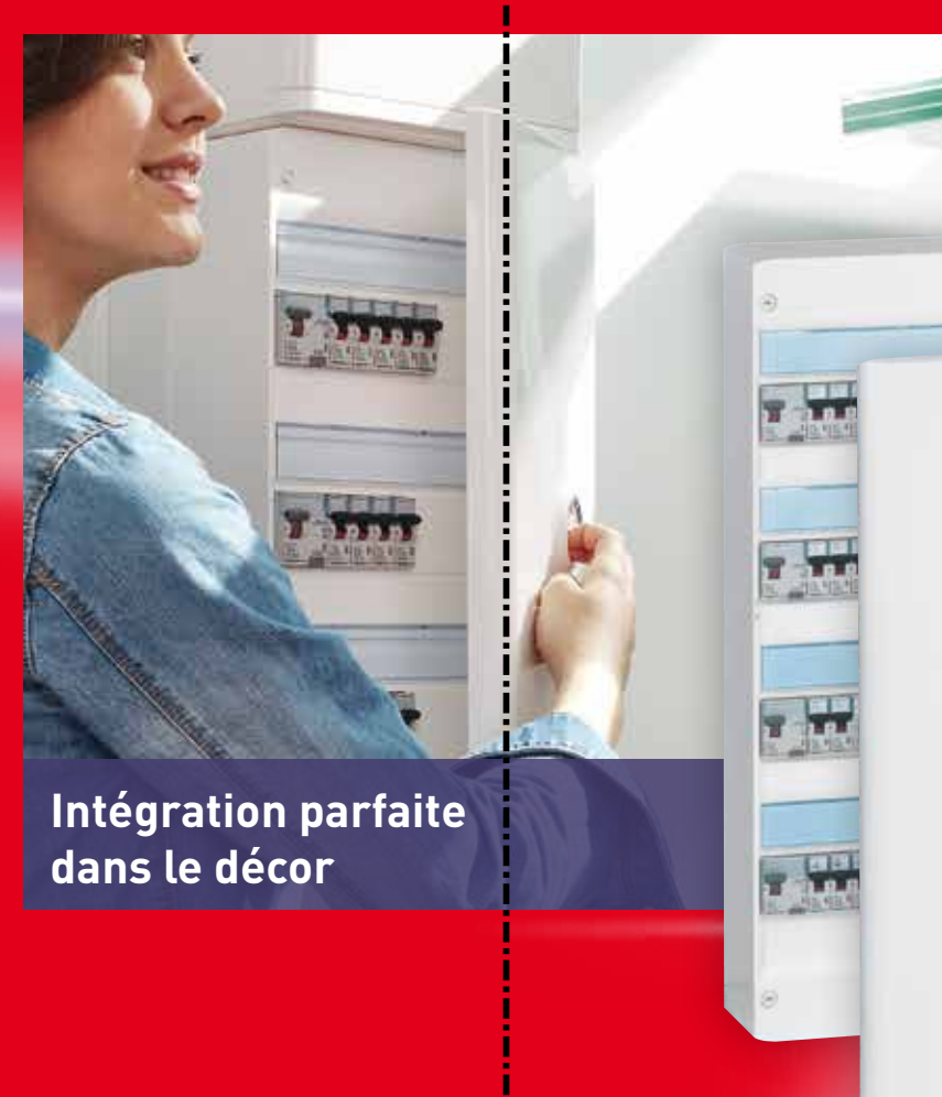
Intégration parfaite dans le décor

TABLEAU ÉQUIPÉ Interrupteurs différentiels : protection des personnes Disjoncteurs : protection des biens et des circuits TABLEAU PRÉCÂBLÉ Peignes horizontaux : alimentation de toute une rangée Peigne vertical : alimentation de toutes les rangées