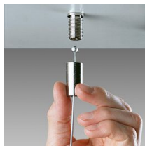
2518 suspension simple