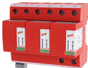
Illustrations sans engagement