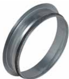
Piquage Equerre sur Plat à joints

Le piquage équerre sur plat à joints permet de réaliser un piquage à 90° sur un conduit de type oblong ou rectangulaire galvanisé.