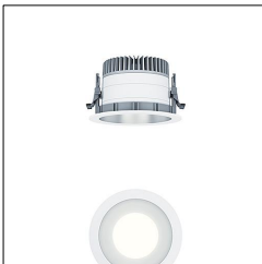
Plafonnier encastré à LED P-INF R150H LED1600-930 LDO SM WH 60818076