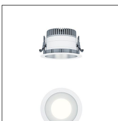
Plafonnier encastré à LED P-INF R150H LED1600-930 LDO SM WH 60818076

La présente déclaration de produit environnemental (EPD) est basée selon les normes EN ISO 14025 et EN 15804 et décrit les impacts spécifiques environnementaux du produit mentionné. Cette déclaration fait suite également aux exigences spécifiques et concrètes du programme Institut Bauen und Umwelt e.V. (IBU) selon les règles de calcul des LCA et le contenu de l'EPD (de base) selon les instructions de PCR sous-jacentes (PCR: Règles de catégorie de produit) pour «Luminaires, lampes et composants pour luminaires» (Ref: IBU PCR Teil A et B). Le produit décrit sert d'unité déclarée. La déclaration inclut une description du produit, des informations sur la composition des matériaux, la production, le transport, la phase d'utilisation, l'élimination et le recyclage, ainsi que les résultats de l'évaluation du cycle de vie. Elle est vérifiée par un organisme indépendant indépendamment conformément à la norme EN ISO 14025. Les EPD des produits de construction sont comparables uniquement si les valeurs sont calculées conformément au même PCR et des scénarios d'utilisation appropriés et obligatoires.