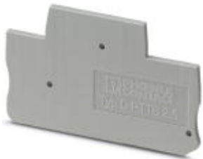
Flasque d'extrémité, Longueur: 68 mm, Largeur: 2,2 mm, Hauteur: 39,6 mm, Coloris: gris

Remarque : les données indiquées ici sont tirées du catalogue en ligne. Vous trouverez toutes les informations et données dans la documentation utilisateur. Les conditions générales d'utilisation pour les téléchargements sur Internet sont applicables. ( http://phoenixcontact.fr/download )