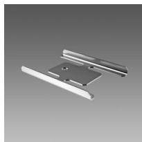
Étrier de jonction - Liset 2.0