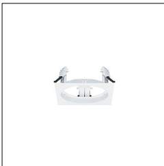
Cadre d'encastrement CAR EVO M Q1 FRAME WH 60800827