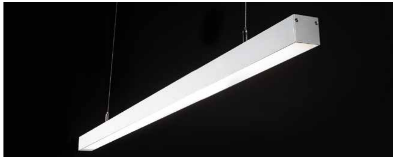
Angle avec diffuseur opale

• J+3 J+7 voir conditions, prix et délais pages 20-21.