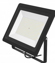
141543 LED Projecteur Slim 100W 9000lm 6500K