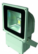
90500032403 LED Projecteur Gris 100W 9400lm 6500K 100V-240V