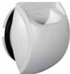
Bap'SI simple débit sanitaire