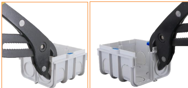
A l'aide d'une pince, retirer les deux parties sécables autour du puit de fixation