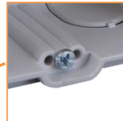
Caches de protection des vis