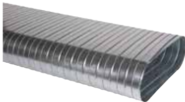
Conduits Spirales Rigides Oblongs

Le conduit galvanisé oblong est une alternative performante aux réseaux rectangulaires permettant le passage de gros débits d'air en espace réduit.