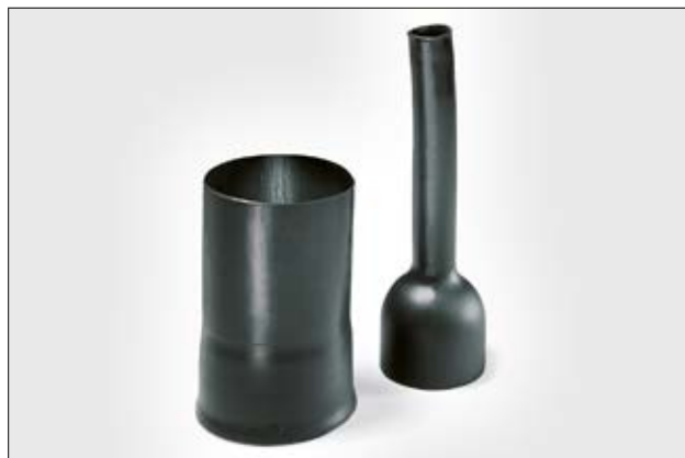
Pièce 135-1-G, avant et après rétreint.

Pour plus d'informations sur les différents matériaux et adhésifs, voir page 272, 273.